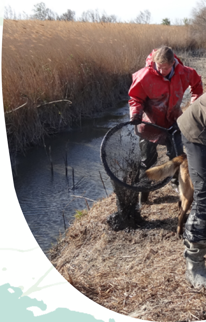
Pêche de sauvetage avant travaux, 2021

Xf - Zones humides d'eau douce dominées par des arbres ; y compris forêts marécageuses d'eau douce, forêts saisonnièrement inondées, marais boisés ; sur sols inorganiques